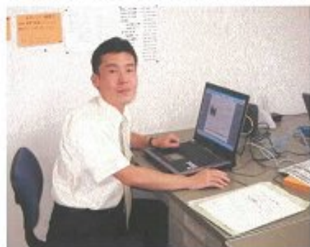
事務所にて事務作業中。外回りと県庁が中心で、事務所にいる時間はほとんどありませんが・・・

参議院選挙では自民、民主、公明、社民、共産党が各公認候補を擁立。埼玉県選挙区は、定数3(埼玉県内で3人が当選できます)に対して5人が名乗りを上げている現状です。また、新座市長選挙に対しては現職以外に立候補を表明している方はおらず、無投票になる可能性も出てきている現状です。