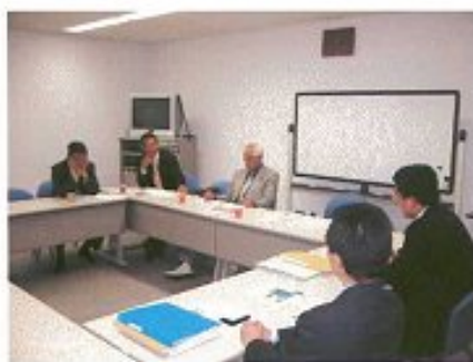
写真は視察中、担当者から話を受けているところ。一箇所数時間は議論する。

5月31日から6月2日にかけて、関西へ視察に行ってきた。大阪、兵庫、岡山と計4箇所の視察を行いました。その中で、特に印象を受けたものとして、岡山県の朝日塾中学校を紹介したいと思います。