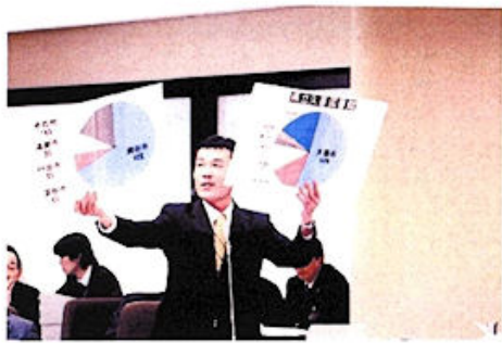
(写真上・県議会・予算特別委員会にて質疑)

我が国のエネルギー供給は8割以上を化石燃料が占め、そのほとんどを海外に依存しています。しかし、価格は世界的なエネルギー重要の不安定化、また、温室効果ガス削減も必須課題であることから、その転換が必要となっています。