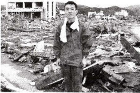
(写真上・昨年の被災地ボランティアにて) 県政報告配布ボランティア大募集!

さらに、約2,800平米の駅前広場などの、ひばりヶ丘駅北口整備とともに、都市計画道路ひばりが丘駅北口線も平成25年度内の完成を目指して西東京市と連携を図ることとしています。